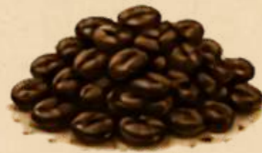
DARK KRACHTIG & INTENS