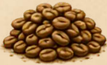
BLONDE ZACHT & KRUIDIG